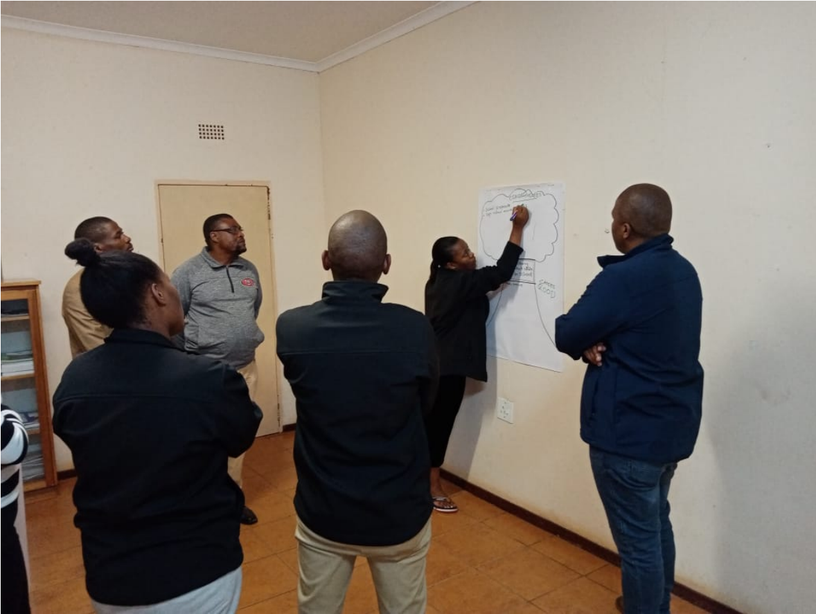
NATICC not only shows great commitment in the implementation of the project, but also in project management