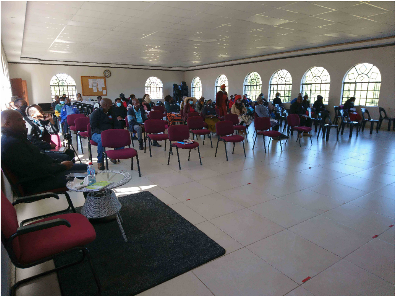
The church is one of the most important institutions in the fight against GBV and TP, as it has a great influence on ideologies and behavior of its members